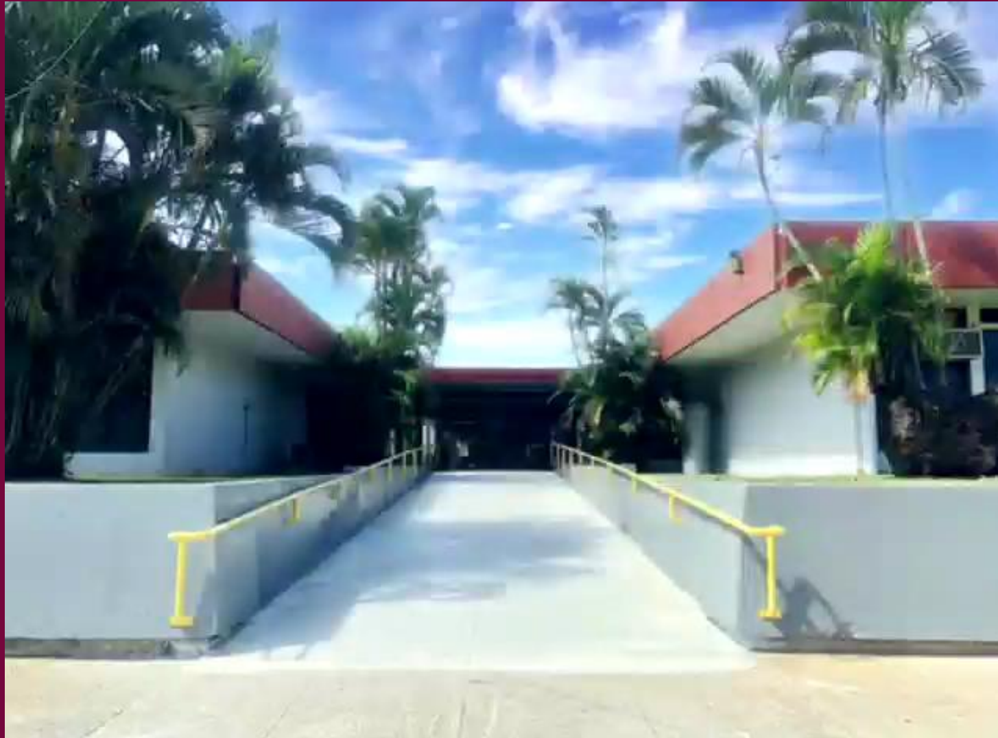
Nueva rampa de acceso en entrada principal