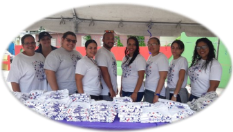
Relevo por la Vida