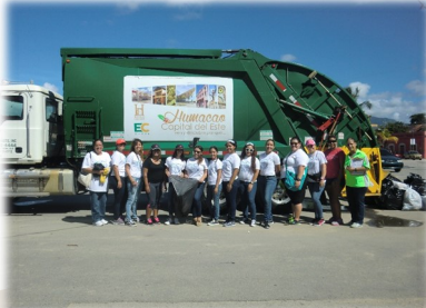
Limpieza de Playas

Limpieza Jardín de ADSO Ciencias Administrativas UPRH