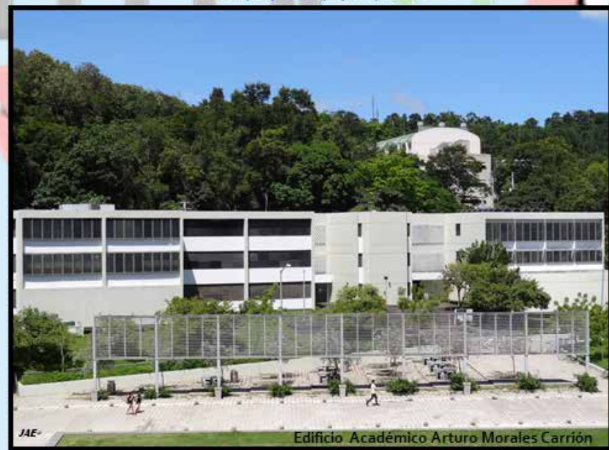
Edificio Académico Arturo Morales Carrión