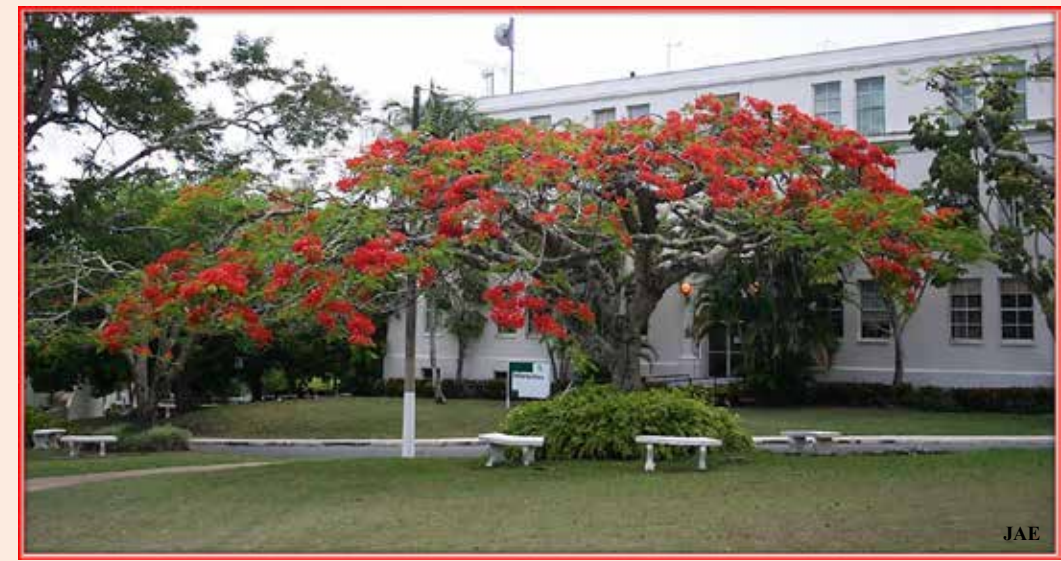
Edificio de Informática Universidad de Puerto Rico en Cayey

Teléfono: (787) 738 -2161 Exts. 2405, 2552