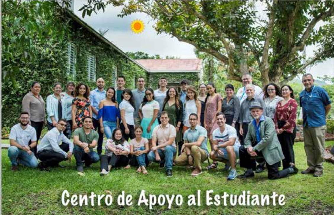
Centro de Apoyo al Estudiante

Contáctanos para más información: Calle Nicolás Jiménez, Esq. Palmer Tel: (787)-263-3770 Facebook: Casa Universidad Email: casauniversidad.cayey@upr.edu