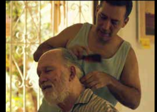
Imagen del video "Algo le pasa a mi héroe", Víctor Manselle, 2015. Campaña "Ellos olvidan, no lo hagas tú" de la Asociación de Alzheimer y Desórdenes Relacionados de Puerto Rico.

R elajación: Parte del tiempo libre, gracias al relevo, debes usarlo para relajarte. Por ejemplo, puedes empezar con una siesta, pero no uses todo tu tiempo de relevo para dormir a menos que sea indispensable. Camina, ve al cine, lee en un parque, medita, o escucha la música de tu preferencia.