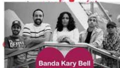
Banda Kary Bell Martes, 14 febrero 10:30 a. m. Cafetería

¡Música en vivo, juegos, premios y otras sorpresas!