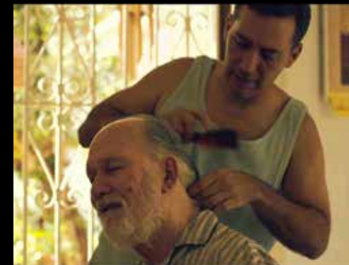
Imagen del video "Algo le pasa a mi héroe", Víctor Manselle, 2015. Campaña "Ellos olvidan, no lo hagan tú" de la Asociación de Alzheimer y Desórdenes Relacionados de Puerto Rico.

Relajación: Parte del tiempo libre, gracias al relevo, debes usarlo para relajarte. Por ejemplo, puedes empezar con una siesta, pero no uses todo tu tiempo de relevo para dormir a menos que sea indispensable. Camina, ve a al cine, lee en un parque, medita, o escucha la música de tu preferencia.