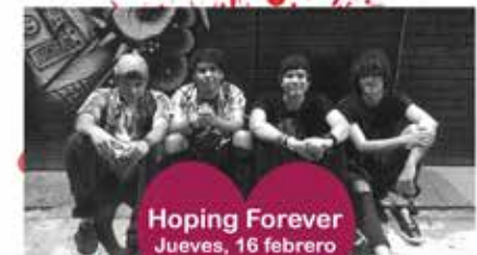
Hoping Forever Jueves, 16 febrero 10:30 a. m. Cafetería

Ventas de artículos con motivo de la amistad por las Organizaciones Estudiantiles