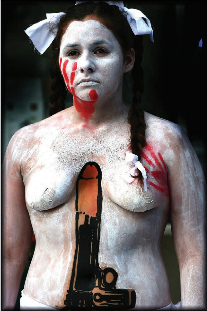
Musa pintada.