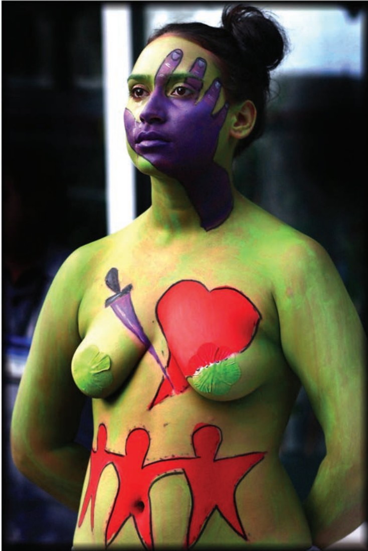
Musa pintada.

performances efectivos como fueron el de las musas desnudas y pintadas y las siete mujeres encadenadas en la Milla de Oro. Esta última manifestación recordó el momento histórico de principios del siglo 20 cuando las feministas inglesas se encadenaron a los pilares del parlamento inglés reclamando el sufragio femenino.