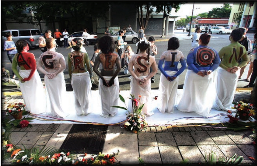
Musa pintada.

Estudiantes y estudiantes universitarios que cursaban el Seminario Periodismo y Género organizaron una dramática manifestación contra la violencia contra las mujeres en la Universidad de Puerto Rico, Recinto de Río Piedras, para significar el 25 de noviembre como Día Internacional de No Más Violencia Contra las Mujeres. Seminarios y cursos siguen formando a nuestro estudiantado en la disciplina de los estudios de las mujeres y el género.