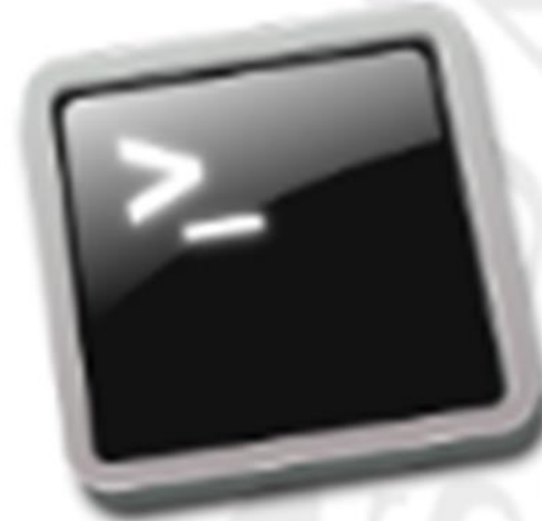
Terminal de matricula