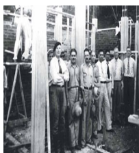
● Oficiales de la PRRA visitan en Castañer la construcción de casas de ladrillos. 1937. v.3-20