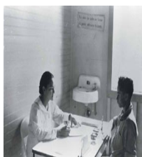
● Dispensario de Salud de Río Blanco, Naguabo. [193-?]. v.10-27.