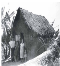
● Familia campesina frente a su bohío. [193-?]. v.3-12.