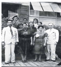
● Reunión de los representantes de Distritos de Cooperativas de Costura en el edificio B. 1939.