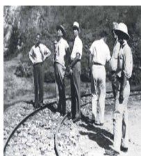
● Inspección de la planta de cemento. 1939. v.7-8.